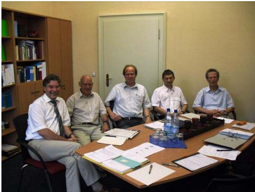
Der Vorstand der Stiftung Jenaer Universitätssport bei seiner Wahlversammlung