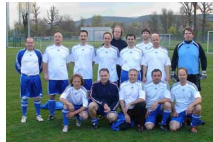
AH-Freizeitteam des USV Jena